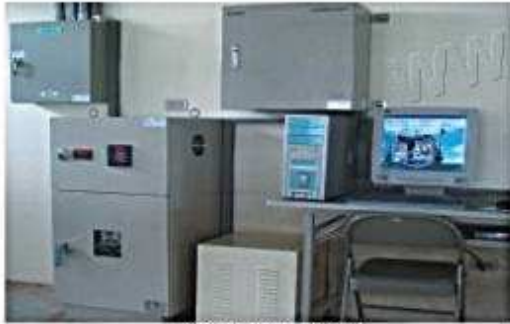
發電與資料收集系統