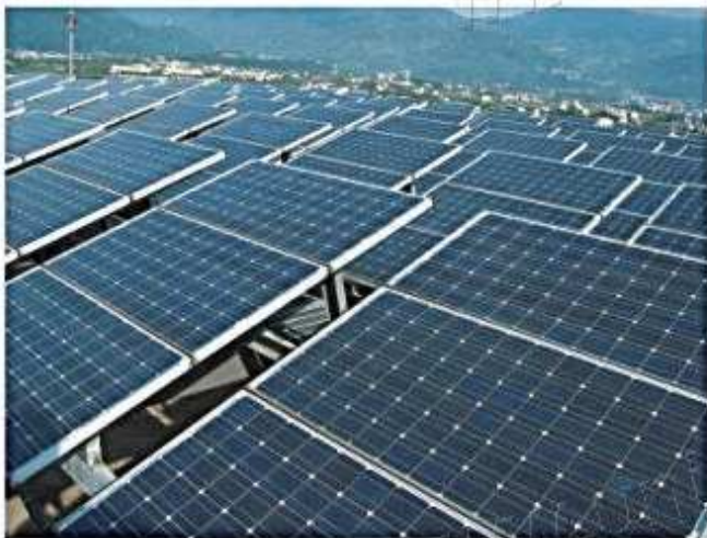
宜蘭地政大樓30kWp市電併聯/緊急供電混用系統