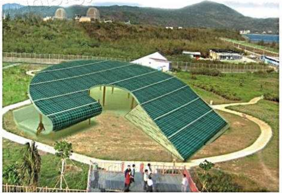
棧三南展管50kWp BIPV系統示意